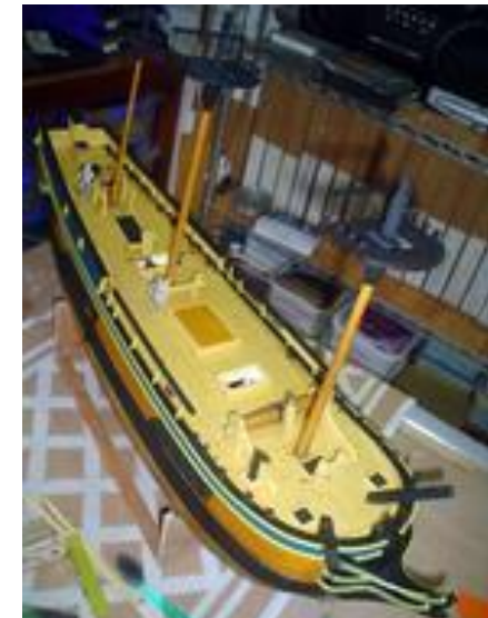
Pose des trois mâts pour vérifier l'alignement et surtout se faire plaisir.