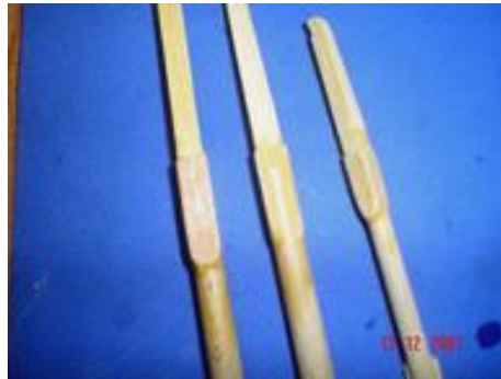
Le sommet des bas-mâts.