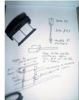
Le croquis me semble suffisant pour les réaliser.