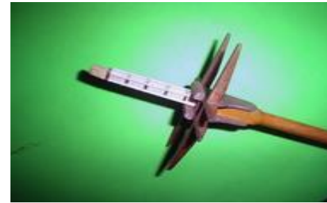
Ensemble terminé. Il faut que l'ensemble coulisse bien entre le cadre formé par les élongis et les traversières qui soutiennent la hune et qui ne sera collée que tout à la fin des opérations. Pour affiner les renforts, on peut les poncer après le collage.