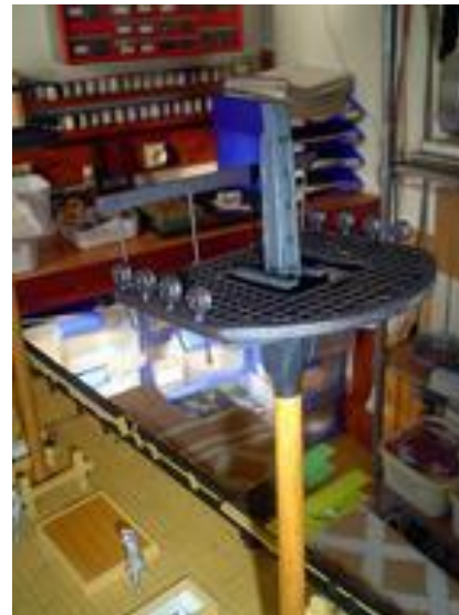
Autre perspective. On distingue bien les cales et les jottreaux auxquels on ajoute quelques clous après collage.