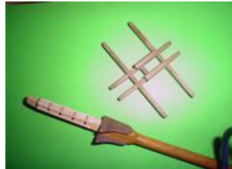
On colle d'abord les colliers (ici, reste de cuivre auto-collant; du bristol ferait l'affaire bien que plus épais) puis les renforts latéraux (très très fines baguettes).