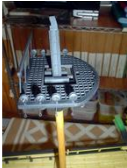
Coup de peinture à la bombe. La hune n'est pas encore collée.